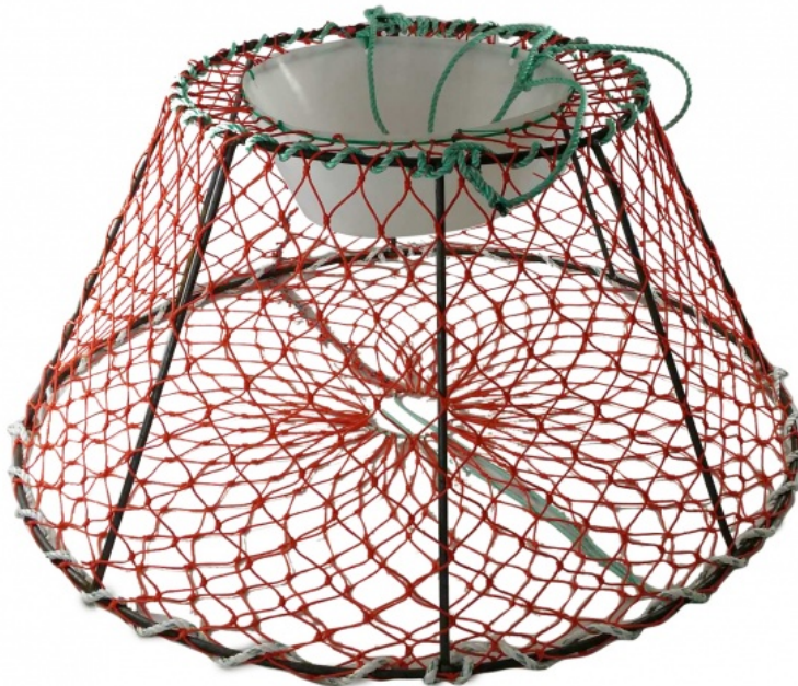
BILDE 3: EKSEMPEL PÅ SNØKRABBETEINE FRA FRØYSTAD. DIAMETER 70-130 CM

Innkjøpspris for fisker vil anslagsvis ligge på rundt 300 – 420 kroner ekskl. mva for snøkrabbeteiner, og mellom 1 300 og 1 900 kroner ekskl. mva for kongekrabbeteiner, avhengig av størrelse.